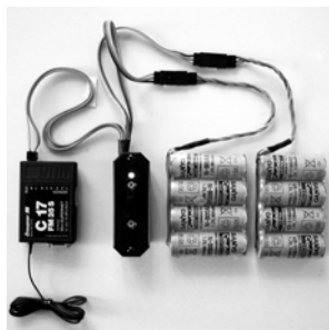
Anschlusschema für JR/Graupner

Weitergehende Ansprüche z.B. bei Folgeschäden, sind ausgeschlossen, ebenso auch die Haftung für Schäden, die durch das Gerät oder den Gebrauch desselben entstanden sind, weil wir den ordnungsgemäßen Einbau und Betrieb nicht überwachen können.