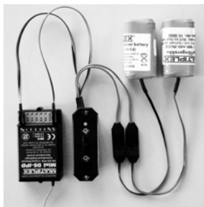
Anschlusschema für MPX